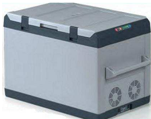
GLACIERE 80L AVEC COMPRESSEUR