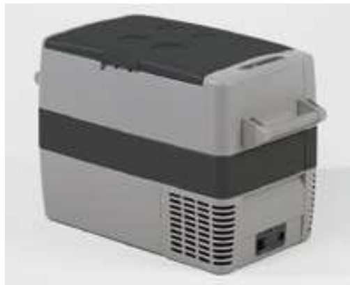
GLACIERE 50L AVEC COMPRESSEUR