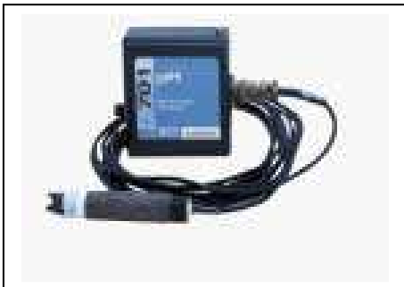
Module 701 : pH