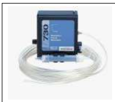
Module 730 : débitmètre bulle à bulle