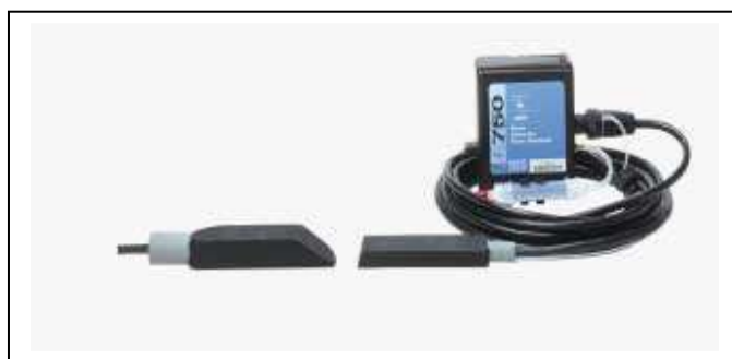
Module 750 : débitmètre Vitesse(Doppler) / Hauteur (pression)