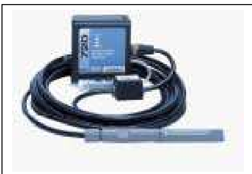
Module 720 : débitmètre piezo