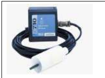
Module 710 : débitmètre US